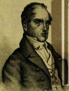
В. Е. Априловъ.