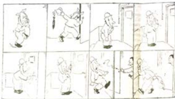
История без думи — Напишете разказе