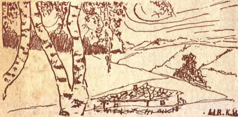
Изгледъ отъ Костенецъ

Ахъ, и колко много рисунки направихъ въ тоя дивенъ кътъ