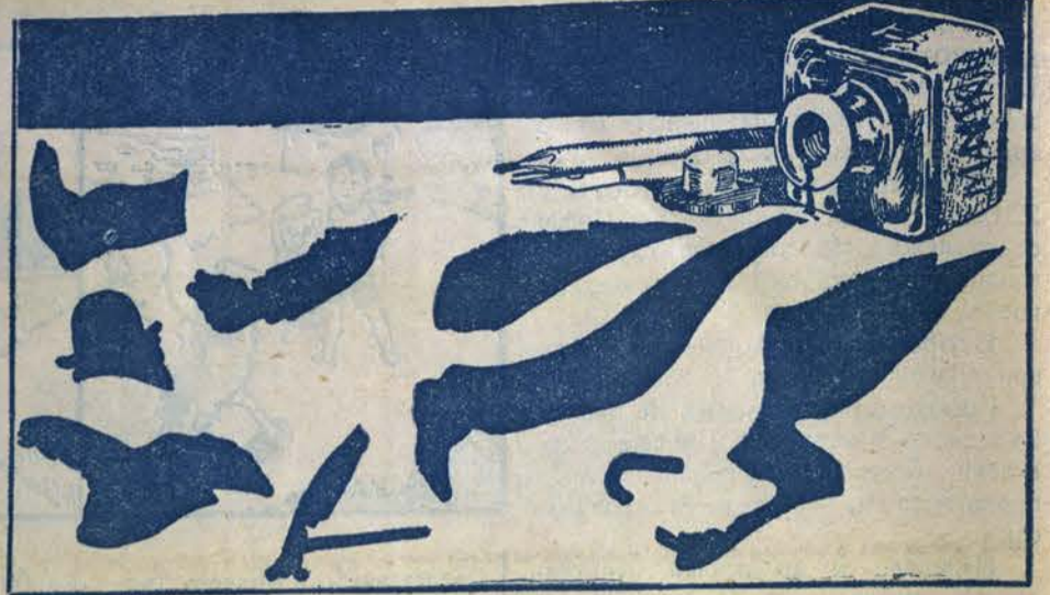
Копирайте тия петна на отдѣленъ листъ, следъ това ги изрѣжете. Съединени частитѣ образуватъ фигура. Каква е тя?