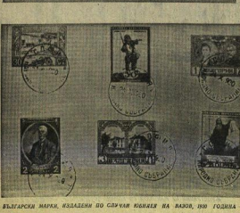
БЪЛГАРСКИ МАРКА, ИЗДАДЕНИ ПО СУФИЯ КЪМ ИВАН ВАЗОВ, 1892 ГОДИНА