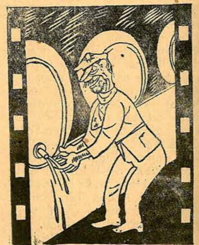
Ала забрави да краде, а почна отъ бѣचितъ, съсь жажда най-порочна, поредъ да вкуса виното отлично и скоро се натряска най-прилично.