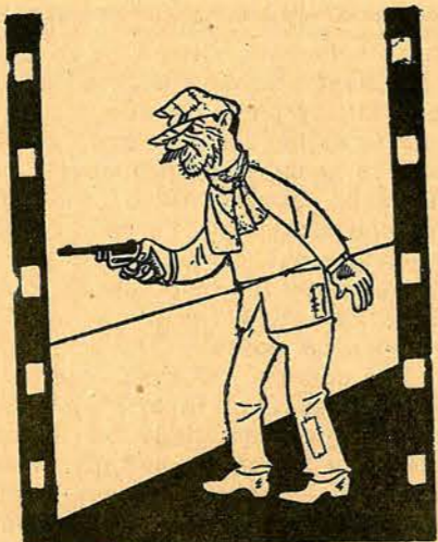
Еднажъ, но късно, като се мръкна, апашътъ Томъ съ pistolетъ се вмѣкна. (тѣй както често случва се на кино), въвъ изба съ много пълни бѣчи вино.

Рисунки отъ Василъ Виденовъ. Текстъ отъ Любомиръ Дойчевъ