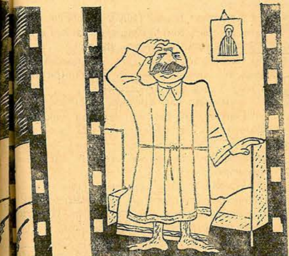
Ала кръчмаря бай Пелинко се пробуди, послуша се и почна да се чуди на този шумъ тамъ долу при вината и бързо, бързо стана отъ кревата.