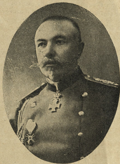
ГЕНЕРАЛЪ Н. ИВАНОВЪ Командващъ II армия отъ 17 IX 1912 г. до 15 VII 1913 г.

СТАРА-ЗАГОРА. На 19 юлий 1877 г. българското опълчение влиза въ първия си бой срещу 25,000 войска на Сюлейманъ паша и забавя съ почти три недѣли неговото настѣпление.