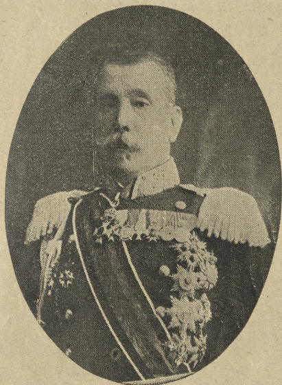
ГЕНЕРАЛЪ М. САВОВЪ Презъ 1912-1913 г. помощ, на главно- командв. и командв. съед. IV и V армии