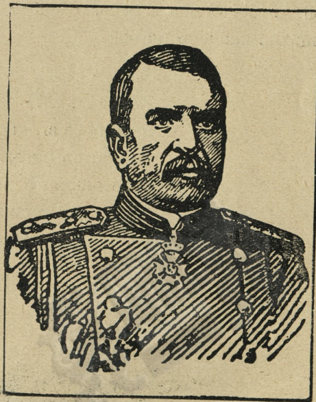
ГЕНЕРАЛЪ Р. ДИМИТРИЕВЪ Командващъ III армия отъ 17 IX 1912 г. до 21 VI 1913 г. въ Балканската война

миръ въ Лондонъ бѣха подновени. Турция се призна победена.