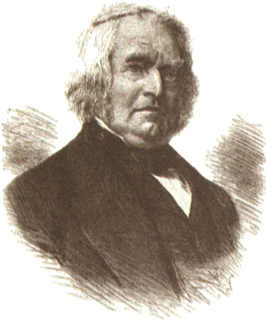
Август Фридрих Пот

Страните, които притежават колонии, се опитват да изпратят ромите там. Подобна мярка обмислят и френските революционни власти в края на XVIII в., но поради продажбата на Луизиана (дн. в САЩ) и поради съпротивата на някои местни служители те не са осъществени. Крайни мерки са прилагани в Холандия (първата половина на XVIII в.) и в Дания (до средата на XIX в.). В тези страни е устройван лов на роми и човешки същества са избивани като дивеч.