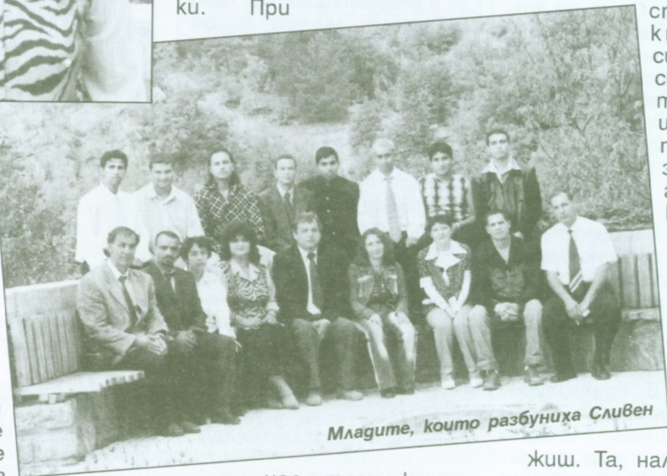
Младите, които разбуниха Сливен

Та дискриминацията е факт и ще бъде факт. Моят съвет е веднага да си съберем съветниците, господата лидери, първо, за да се направи едно обучение, защото повечето от тях са полуграмотни, познаваме се не от вчера. Второ, хората, които бяха излъчени от тези листи, нямат никакъв опит, ние не сме правили политически кампании, а ако сме правили, са били съвсем нищожни или сме играли за други. Дайте да си съберем съветниците, да видим кой кой е, да видим от коя партия е, дайте да си направим обученията, дайте да видим кой какво ще иска, и то съвсем спешно от кметовете си в общинските съвети. Кой как ще си прави пазарлъците, защото много е важно, когато седнеш в общинския съвет, да знаеш какво да говориш и какво да искаш, и какво да