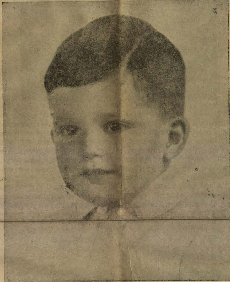
Българското дете — Князь Симеонъ Търновски по случай рожденияму день — 16 юний

„Бждете изпълнители на словото, а не само слушатели, мамещи сами себе си. Защото, който слуша словото и го неизпълнява, той прилича на човѣкъ, който гледа естественото си лице въ огледало: погледне се, отмине, и веднага забравя, какъвъ е билъ. Но който вникне въ свършения законъ на свободата и пребже въ него, той... ще бжде блаженъ въ действията си“.