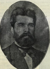
ИВ. ВАЗОВЪ прѣвъ 1881 година.

На 17 юли министърът на нар. просвещение г-нъ Ст. Омариески поднесе на поета народното дарение, придруженъ отъ много книжници и писатели. Подписането стана на 9 часа въ дома на г. Вазова, дѣто г. министърът, сълаж като въ високо импровизиран думи изтъква значението на поета за българската книжнина, равно съ тогавашния Пупулова за руската и на Минскиевъ за полската, прочете отгано приготвена рѣчь и му поднесе народния даръ ведно съ брой 81 отъ „Държавенъ вѣст-