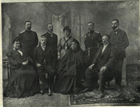
Семейството на поета

На 6 юли двата комитета — книжовниятъ и организационниятъ — държатъ съвместно заседание и, покрай другото рѣшаватъ: 1. „въ помяното и най-важниятъ случай“ да дѣлствуватъ съвместно и 2. „да издѣлятъ съ едною общъ позивъ къмъ българския народъ, въ който, като се помисли голѣмото значение на готвещото се тържество, да се открие и подписка за фонда „Ив. Вазовъ“, по организацията на който комитетътъ доизпълнено ще се сире“. Поводъ за основаването на този фондъ дава народното дарение, което заставя софийския търговецъ Ив. Димитровъ да се отнесе на 30 юли до г-нъ министра съ едно заявле-