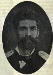
ИВ. ВАЗОВЪ като седящ прѣвъ Румелийско врѣме