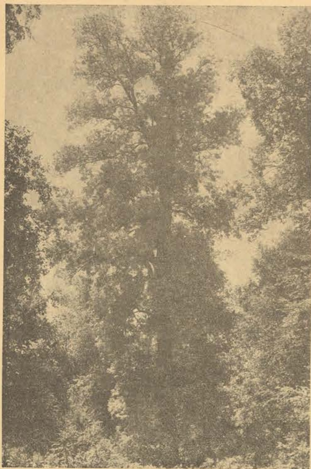
Изъ лонгоза. Дърво Осень възраст 150 г. вис. 38. м.

ДЪРВЕТАТА РАСТАТЪ НА ЗЕМЯТА ЗА ДОБРОТО НА ХОРАТА.