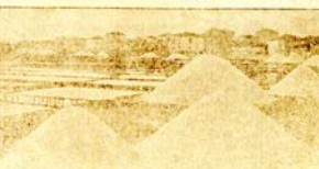
Вѣдѣшитътъ солоникъ край гр. Поморна.