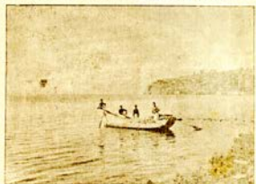
Охридското езеро съ честь отъ гр. Охридъ, македонската Железа. Висада се помещаватъ чужди (чѣлтъ) — корабъ-лодки.

* Министерството на народната просвѣта е обзавело за народни старини часовната кула, куршумку чешма и бѣстена (покрити пазаръ) въ гр. Шуменъ.