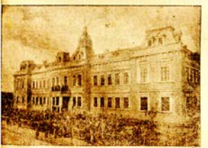
Педагогическото училище въ гр. Силистра, дадено на България много възражени учители. Сега се реконструирва и управлявано.