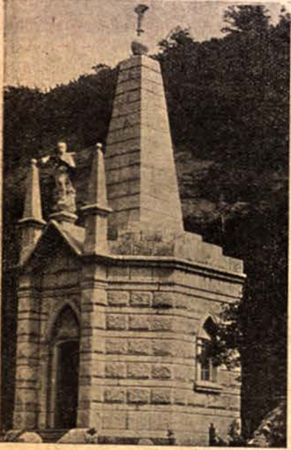
Мавзолеятъ съ коститѣ на убититѣ въ Дръновския манастиръ.

Внезапно дългата върволица четници спрѣ. Тихъ шѣпотъ, предаденъ отъ ухо на ухо, смрази въдушевения имъ поривъ. Дветѣ скали на манастиря бѣха почернѣли отъ турски аскеръ. Бѣха заградени отъ всѣкъде. Не имъ оставаше нищо друго освенъ да се предадатъ или да се борятъ.