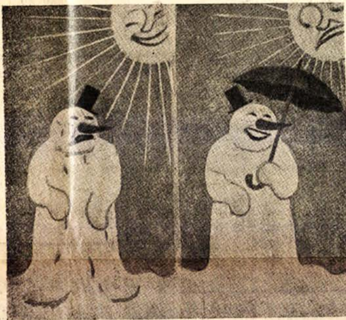
Напишете съчинение по тази картина! Най-хубавото ще бжде наградено и напечатано въ в. „Славейче“

другия день той повикалъ говедарчето си.