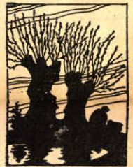
Какво е скрито тукъ?