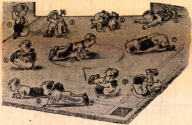
Всёко здравче — малко и голямо, тръбва да свикие сутрин да играе тия леки упражнения, които дават сила и здраве.