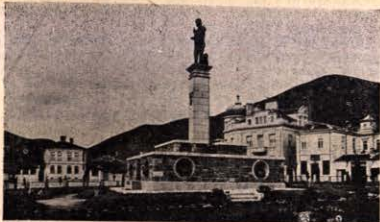
Паметникът на Хадни Димитър—великия борец за свободата на България.