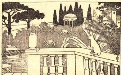
9. Къде се е крила другата котка?

Отъ Леяя Заравка 8. Живя въ зьмента, цъфта ми е оранижъ и кръвъ на децата давятъ, който ме яде всъки дьнь, бодро здравяе мене. Задавъ: Сергей Борисовъ ученикъ, Русъ