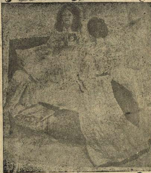
Моли се на Бога!

рога, напудрени съ брашно, червена боя, съ дървета, коллове, дървенъ бръсначъ, четка и пр. — кукеритѣ сж страшни. Събиратъ подарѣци: пари, жито, брашно, хлѣбъ: сланина и др. Лудурии . . . шеги . . . игри . . . хора . . .